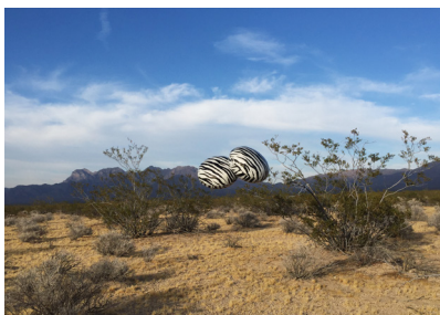
Occasion, 2016 © Barbezat-Villetard