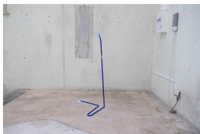
Snark, 2017 , néon blacklight, câbles et transformateur, Fabrikculture Hegenheim © Barbezat-Villetard