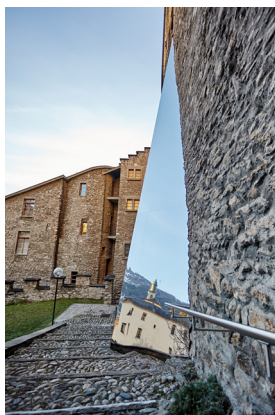
a dissident room, 2015 © Guillaume Collignon